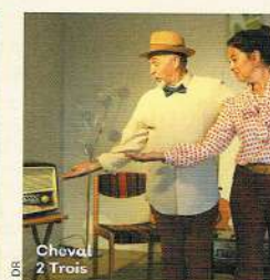
Cheval 2 Trois